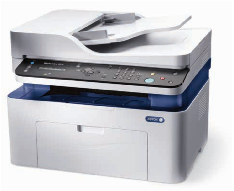
WorkCentre 3025. Копирование. Печать. Сканирование. Факс.*

* Факс и автоподатчик ADF предусмотрены только для модели WorkCentre 3025NI.