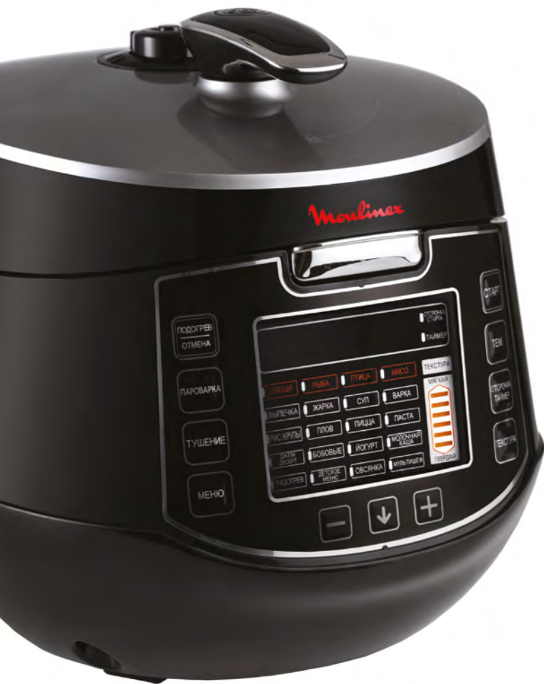
МУЛЬТИВАРКА MOULINEX CE502832