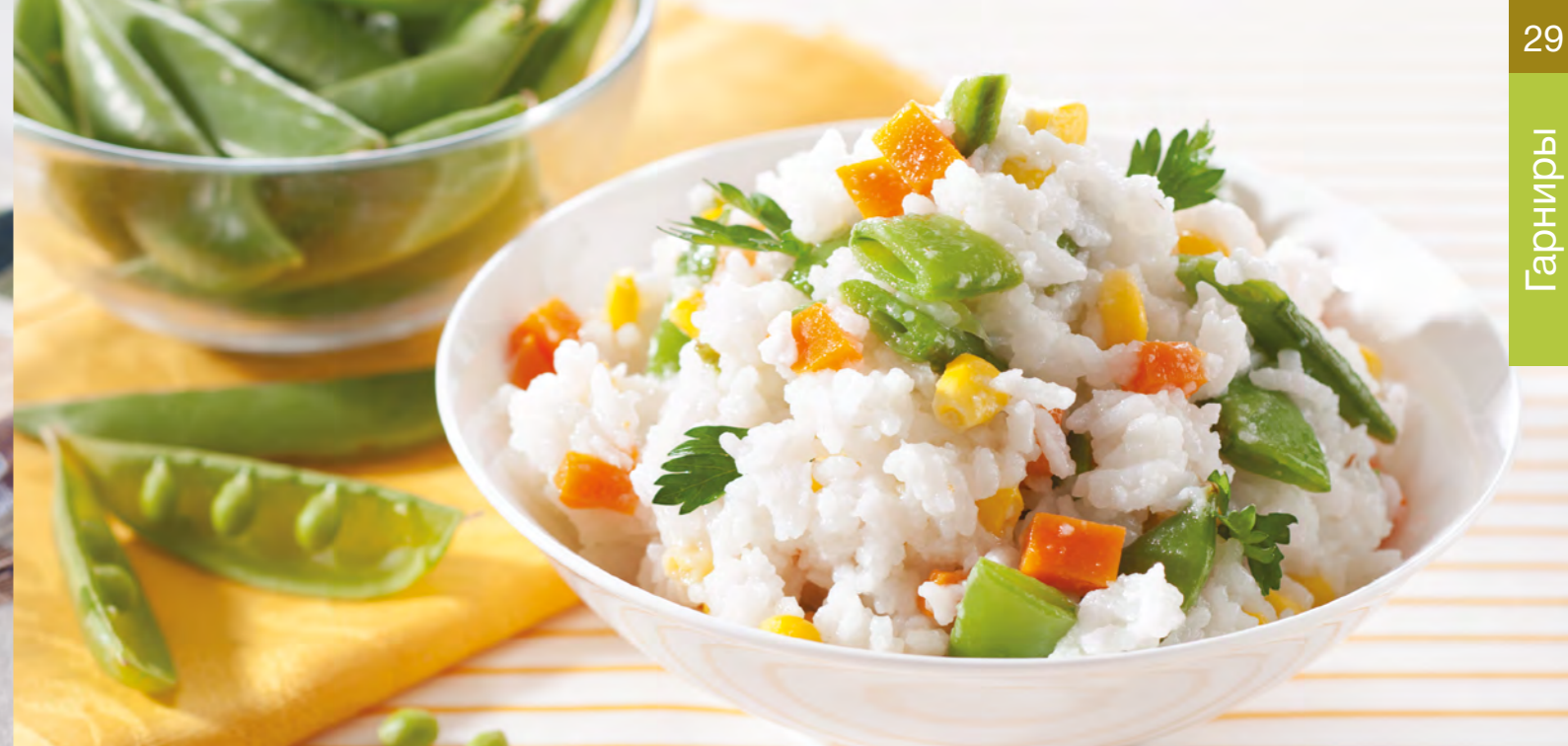
Рис с овощами

Совет: Вешенки можно заменить любыми другими грибами.