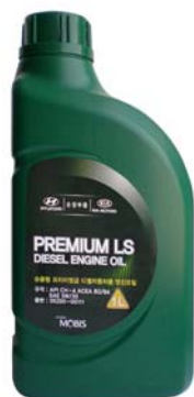
1 л - 05200-00111

Полусинтетическое моторное масло для дизельных двигателей. Предотвращает образование нагара, окисление и коррозию. Обладает хорошими моющими свойствами. Категория API CH-4.