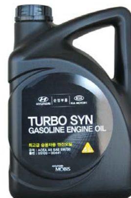
4 л - 05100-00441