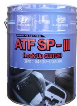
20 л - 04500-00A00