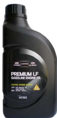
1 л - 05100-00151

Синтетическое моторное масло с улучшенными эксплуатационными характеристиками. Рекомендуется для всех типов бензиновых двигателей концерна Hyundai Kia выпущенных после 2005 года в качестве особенно рекомендуемого. Обязательно к применению для обеспечения устойчивой работы двигателей с CVVT (система изменения фаз газораспределения выпуска компании Hyundai), начиная с моделей двигателей 2L Beta I4 (автомобили Hyundai Elantra и Kia Spectra с 2005 года выпуска), Alpha II DOHC (автомобили Hyundai Accent/Verna, Tiburon, Kia cee'd с 2006 года выпуска).