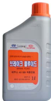
1 л - 01100-00110

Тормозная жидкость уровня качества DOT-4 для тормозных систем автомобилей Hyundai, KIA концерна Hyundai Motor Company (HMC).