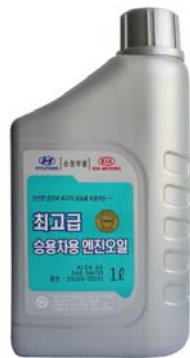
1 л - 05100-00141

Современное синтетическое энергосберегающее моторное масло, рекомендованное к всепогодному применению в двигателях автомобилей Hyundai и Kia с турбонаддувом и без него. Обязательно к применению для обеспечения устойчивой работы двигателей с CVVT (система изменения фаз газораспределения выпуска компании Hyundai), начиная с моделей двигателей 2L Beta I4 (автомобили Hyundai Elantra и Kia Spectra с 2005 года выпуска), Alpha II DOHC (автомобили Hyundai Accent/Verna, Tiburon, Kia cee'd с 2006 года выпуска). Отличные температурно-вязкостные характеристики обеспечивают надежную защиту двигателя от износа во всем диапазоне рабочих температур. Синтетическая основа масла обеспечивает лёгкий холодный пуск двигателя даже при экстремально низких температурах. Высокая стабильность вязкостных характеристик в течение всего срока службы способствует экономии топлива. Не оказывает вредного воздействия на самые современные системы очистки выхлопных газов. Категории API SM, ILSAC GF-4, ACEA A3