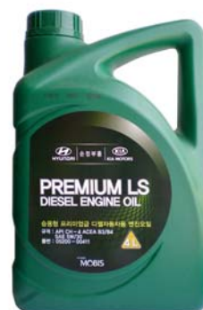
4 л - 05200-00411