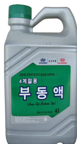
4 л - 07100-00400

Оформить заказ на основании оригинальных номеров Hyundai Kia Вы можете на нашем сайте www.oem-oil.ru или обратившись к закреплённому за Вами менеджеру.