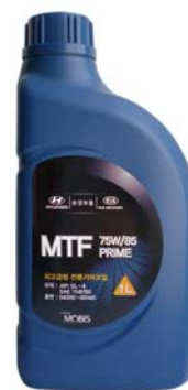
1 л - 04300-00140