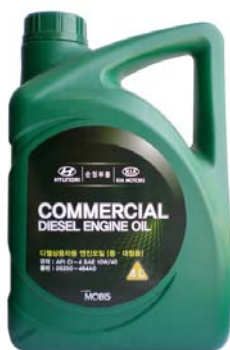
4 л - 05200-484A0

Высококачественное полусинтетическое масло для дизельных моторов легковых и грузовых автомобилей, в том числе оснащенных турбонаддувом, интеркулером или непосредственным впрыском. Производится на основе базового масла, полученного по технологии гидрокрекинга — использование данной технологии позволяет обеспечить высочайший уровень эксплуатационных и защитных свойств и соответствует самым высоким требованиям современных высоконагруженных дизельных двигателей. Гидрокрекинговое базовое масло сочетается с передовой системой присадок, что позволяет достичь высокого уровня защиты всех частей двигателя. Данное моторное масло обладает очень высокими эксплуатационными свойствами, специально создано для обеспечения исключительной защиты современных высокофорсированных дизельных двигателей. Подходит для использования в высокомоощных двигателях, работающих в тяжелонагруженных дорожных и внедорожных машинах.