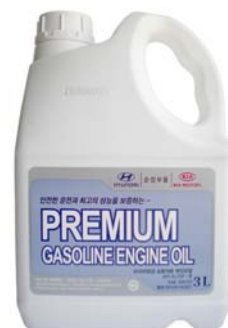
Оригинальный номер 3 л - 05100-00321