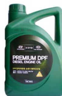
6 л – 05200-00620