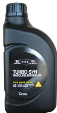
1 л - 05100-00141