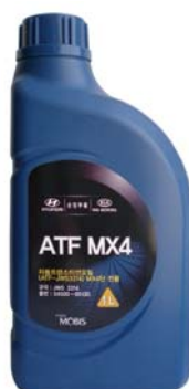
1 л - 04500-00130

Полусинтетическое масло для 4-х ступенчатых автоматических коробок передач JF402E и JF405E. Hyundai SANTRO 1.1L, Hyundai Atoz, KIA MORNING 1.0L и 1.1L, KIA PICANTO 1.0L и 1.1L, KIA VISTO 0.8L