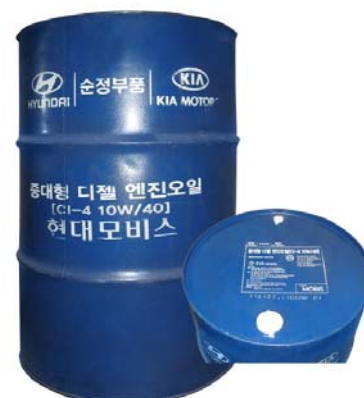
200 л - 05200-48CA0