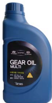
1 л - 02200-00110