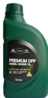
1 л - 05200-00120

Новейшее синтетическое беззольное моторное масло разработано эксклюзивно для HYUNDAI и KIA для новейших дизельных двигателей выпуска с 2007/08 года. Разработано для обеспечения оптимального срока службы сажевого фильтра в дизельных двигателях. Это масло рекомендуются для всех дизельных двигателей с сажевым фильтром. Соответствует высоким на сегодняшний день требованиям HYUNDAI и KIA к качеству. Категория ACEA C3.