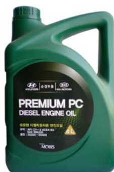
4 л - 05200-00400