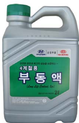
2 л - 07100-00200

Эффективная защита от кавитации и коррозии алюминиевых радиаторов.