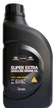
Оригинальный номер 1 л - 05100-00110

Полусинтетическое моторное масло с улучшенными эксплуатационными характеристиками. Рекомендуется для всех типов бензиновых двигателей концерна Hyundai Kia в которых автопроизводитель рекомендует применять масла с вязкостью SAE 5W-30 и уровнем качества API SL и ILSAC GF-4. Содержит тщательно подобранные присадки для достижения оптимальных эксплуатационных характеристик. Его смазывающие свойства сохраняются даже при интенсивном вождении благодаря качеству используемого базового масла и присадок. Противостоит отложению сажи и нагара, способствует содержанию двигателя в чистоте и обеспечивает отличное состояние сальников. Гарантирует лёгкий запуск и смазывание двигателя в холодную погоду и представляет собой минеральное масло исключительного качества с превосходными эксплуатационными характеристиками. Масло с добавлением высококачественных присадок, поддерживает превосходные эксплуатационные характеристики двигателя и малый расход топлива, поэтому является самым распространенным маслом. Категория качества API SL, ILSAC GF-3.