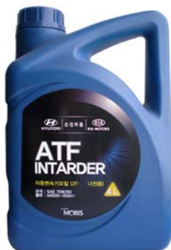
4 л - 04500-00440

Специальное синтетическое трансмиссионное масло для АКПП ZF ASTRONIC устанавливаемых на грузовые автомобили и автобусы HYUNDAI/KIA. Например Hyundai Trago, Hyundai New Power Truck, Hyundai Bering HD или Bering HDMX, Hyundai HD120, Hyundai Cargo Truck, Hyundai Tractor Truck, Hyundai Dump Truck, Hyundai HD65/72/78, Hyundai Unuverse BUS, Hyundai Aero Town BUS, Hyundai Super Aero City, Kia Granbird Bus