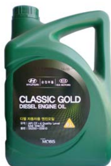
6 л - 05200-00610