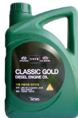
4 л - 05200-00410