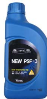
1 л - 03100-00110 – светло-коричневого цвета