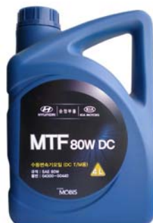
4 л - 04300-00440

Минеральное трансмиссионное масло для МКПП и раздаточных коробок автомобилей HYUNDAI и KIA.