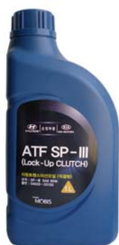
1 л - 04500-00100

Полусинтетическое трансмиссионное масло для большинства четырёх и пятиступенчатых АКПП автомобилей HYUNDAI и KIA. Обеспечивает плавное переключение передач в широком диапазоне температур, обладает стабильностью фрикционных свойств, высокой текучестью при низких температурах, хорошей совместимостью с большинством изделий из металлов и эластомеров, обеспечивает защиту от протечек и износа.