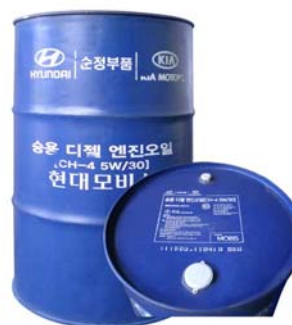
200 л – 05200-00C11