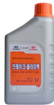
1 л - 01100-00100