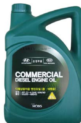
6 л – 05200-486A0