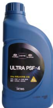
1 л - 03100-00130

Специальная синтетическая жидкость зелёного цвета для гидроусилителя руля автомобилей Hyundai, KIA концерна Hyundai Motor Company (HMC).