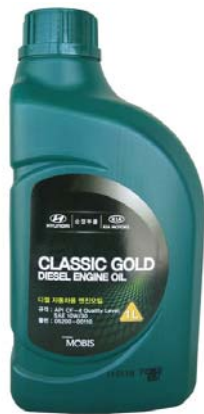
1 л - 05200-00110

Высококачественное моторное масло для дизельных двигателей, оснащенных турбиной и без нее. Разработано специально для дизелей HYUNDAI и KIA. Предотвращает образование нагара, окисление и коррозию. Обладает хорошими моющими свойствами. Категория API CF-4.