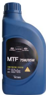
1 л - 04300-00110

Всесезонное полусинтетическое трансмиссионное масло, совместимо со всеми материалами уплотнений и эластомерными материалами, а также с металлами и сплавами, используемыми в трансмиссиях автомобилей Hyundai и Kia. Тщательно подобранный высокоэффективный пакет присадок и синтетическая технология производства базовых масел позволяют сохранять исключительную текучесть при низких температурах и прекрасные синхронизирующие свойства в различных эксплуатационных условиях, одновременно обеспечивая лёгкое переключение передач. Продукт обладает великолепными вязкостными и противоизносными характеристиками, благодаря новейшей технологии присадок обеспечивает сверхвысокую защиту от износа в широком диапазоне температур. Обеспечивает очень легкое переключение передач, обладает высокими синхронизирующими свойствами одновременно с надежной защитой от износа гипоидных и цилиндрических передач. Обладает превосходными низкотемпературными свойствами, гарантирует смазывание всех пар трения даже при очень низких температурах. Высокие антиокислительные свойства гарантируют чистоту деталей трансмиссии.