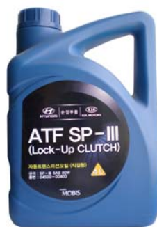
4 л - 04500-00400