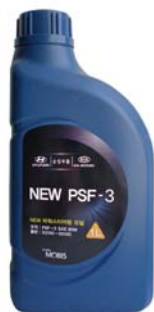
1 л - 03100-00100 – красного цвета

Специальная полусинтетическая жидкость для гидроусилителей руля автомобилей Hyundai, KIA концерна Hyundai Motor Company (HMC).