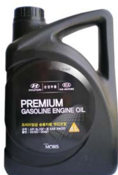
Оригинальный номер 4 л - 05100-00421