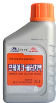
0,5 л - 01100-00A00

Тормозная жидкость уровня качества DOT-3 для тормозных систем автомобилей Hyundai, KIA концерна Hyundai Motor Company (HMC).