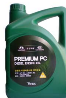
6 л - 05200-00600