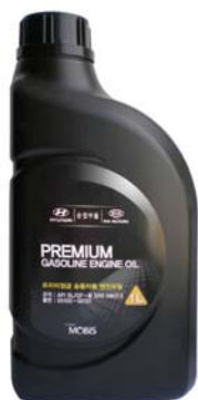
Оригинальный номер 1 л - 05100-00121

Полусинтетическое моторное масло с улучшенными эксплуатационными характеристиками. Рекомендуется для всех типов бензиновых двигателей концерна Hyundai Kia выпущенных после 2005 года в качестве особенно рекомендуемого. Обязательно к применению для обеспечения устойчивой работы двигателей с CVVT (система изменения фаз газораспределения выпуска компании Hyundai), начиная с моделей двигателей 2L Beta I4 (автомобили Hyundai Elantra и Kia Spectra с 2005 года выпуска), Alpha II DOHC (автомобили Hyundai Accent/Verna, Tiburon, Kia see'd с 2006 года выпуска). Содержит тщательно подобранные присадки для достижения оптимальных эксплуатационных характеристик. Его смазывающие свойства сохраняются даже при интенсивном вождении благодаря качеству используемого базового масла и присадок. Противостоит отложению сажи и нагара, способствует содержанию двигателя в чистоте и обеспечивает отличное состояние сальников. Гарантирует лёгкий запуск и смазывание двигателя в холодную погоду и представляет собой минеральное масло исключительного качества с превосходными эксплуатационными характеристиками. Масло с добавлением высококачественных присадок, поддерживает превосходные эксплуатационные характеристики двигателя и малый расход топлива, поэтому является самым распространенным маслом. Категория API SL, ILSAC GF-3.