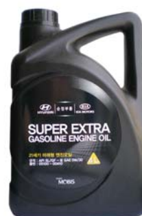
Оригинальный номер 4 л - 05100-00410