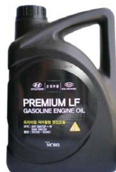
4 л - 05100-00451