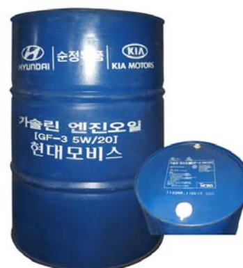
Оригинальный номер 200 л – 05100-00C21