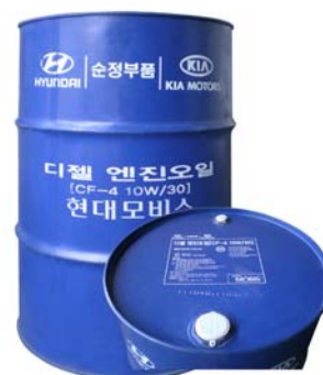
200 л - 05200-00C10