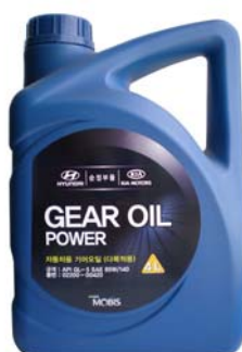
4 л - 02200-00420

Изготовлено на основе высокоочищенного минерального базового масла с добавлением комплекса специальных EP (Extreme Pressure) присадок. Надёжно защищает коробку передач и узлы трансмиссии легковых и грузовых автомобилей, внедорожной и специальной техники при экстремально тяжёлых условиях эксплуатации, включая эксплуатацию автотранспорта в условиях открытых карьеров. Обеспечивает долговременную защиту агрегатов строительной и грузовой техники в условиях высоких переменных нагрузок. Предназначено для современных коробок