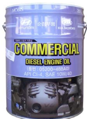
20 л - 05200-48BA0