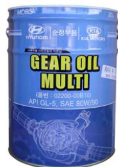
20 л - 02200-00B10

Всесезонное трансмиссионное масло для использования в широком ряде механизмов с прямозубыми, косозубыми и коническими шестернями, совместимо со всеми материалами уплотнений и эластомерными материалами, а также с металлами и сплавами, используемыми в трансмиссиях автомобилей Hyundai и Kia. Создано из минеральных масел высшей очистки, с использованием самых современных противоизносных, антифрикционных, антиокислительных, антипенных и других присадок. Специально подобранные компоненты обеспечивают легкое переключение передач трансмиссии и одновременно гарантируют высокую защиту от износа для шестерен и подшипников. Не образует пену и эмульсии, обеспечивает постоянную смазку и максимальный отвод тепла. Превосходные пластические свойства обеспечивают смазывание при больших удельных давлениях. Превосходная защита от износа, гарантирующая длительную живучесть частей (зубчатые колёса, подшипники, валы, переключатели, и т. п.). Особые вязкостно-температурные свойства этого масла позволяют использовать его всесезонно в широком интервале температур и обеспечивают текучесть при низких температурах. Высокий показатель вязкости гарантирует плавную работу элементов трансмиссии при любых температурах эксплуатации.