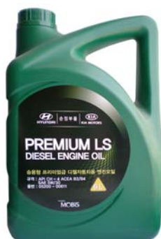
6 л – 05200-00611