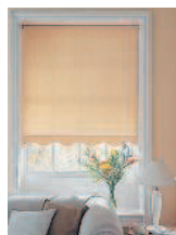
roller blind [ˌrɒlɚəˈblaɪnd] роулэ блайнд штора