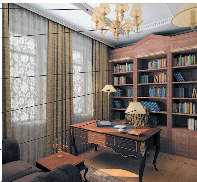
study [ˈstʌdi] стади кабинет