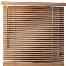
venetian blind [vəˌniːfɪnˈblaɪnd] вэни:шн блайнд жалюзи