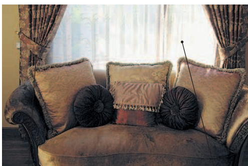
curtain [kɜːtɪn] кэ:тн портъера